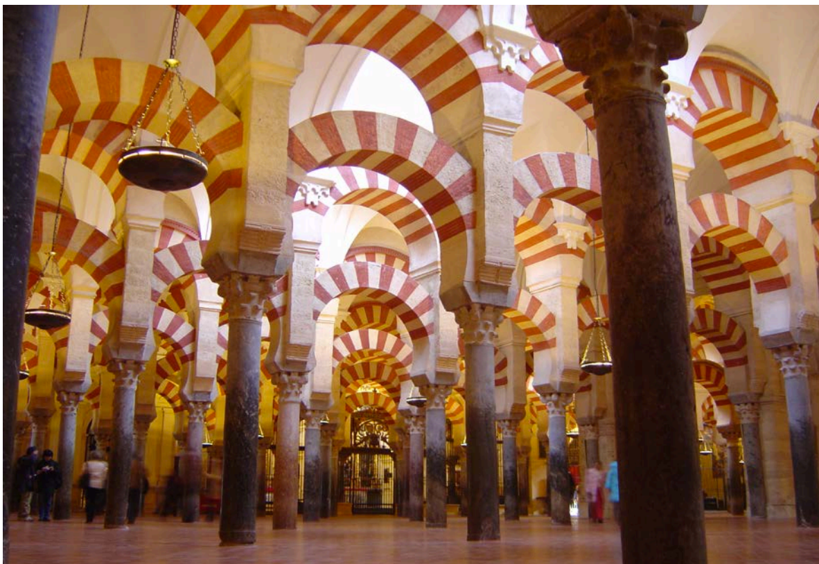
Imagen en Wikimedia Commons de dominio público

Información gráfica 1: Observa la siguiente imagen y responde a las preguntas que se plantean a continuación: