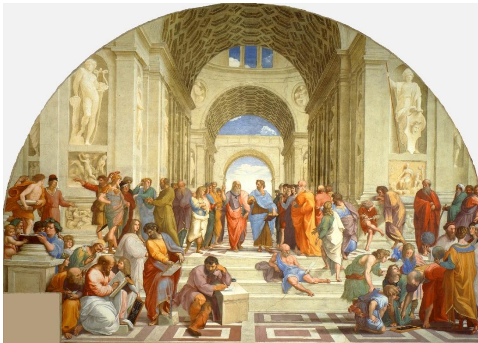
La escuela de Atenas Rafael Sanzio Dominio público