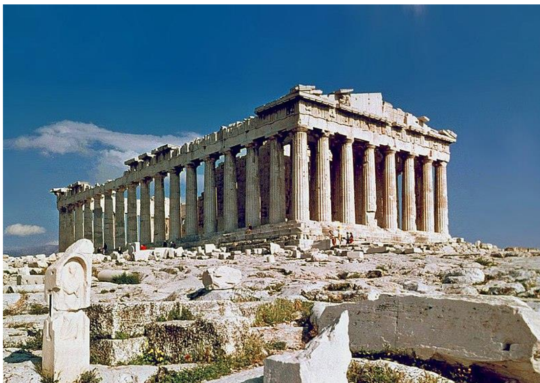
Imagen en Wikimedia Commons de dominio público

Información gráfica 1: Vas a viajar a Grecia con tu familia y quieres documentarte sobre las obras de arte más emblemáticas. Para ello, observa la siguiente imagen y responde a las preguntas que se plantean a continuación: